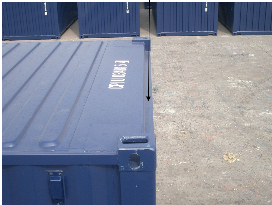
Rail latéral inférieur (section double en «Z»)